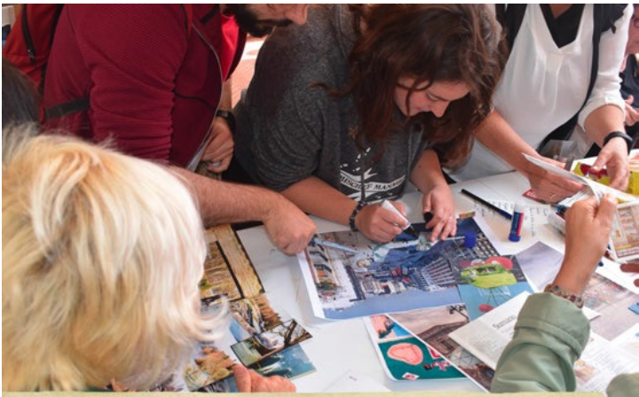
CREATIVITY & CURIOSITY