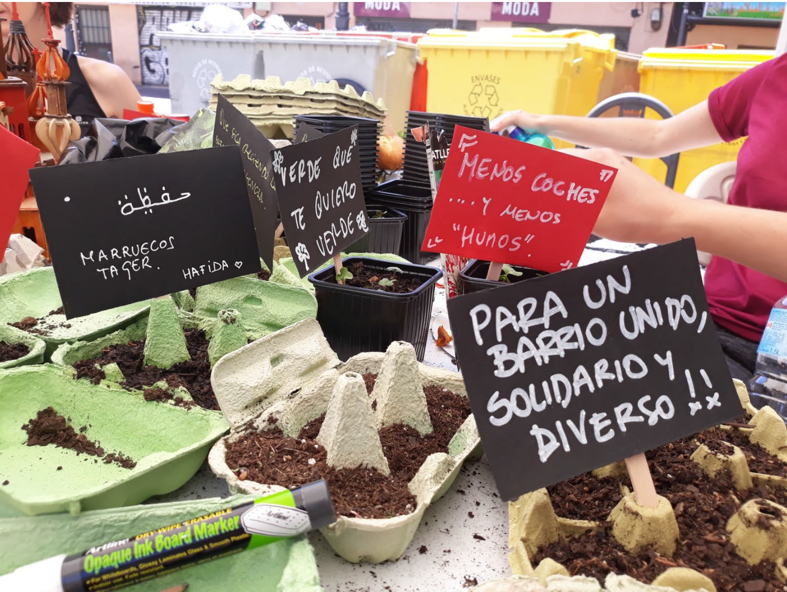
What do you want to germinate in your neighborhood? Seedbeds for a vertical garden. CMSc Puente de Vallecas