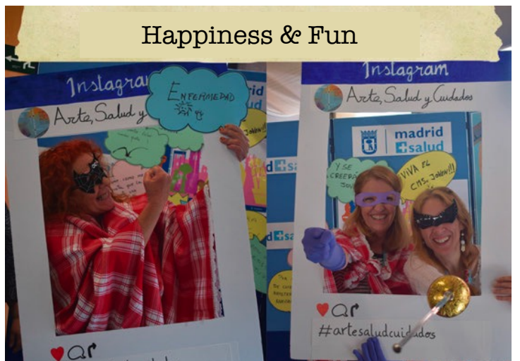
Happiness & Fun