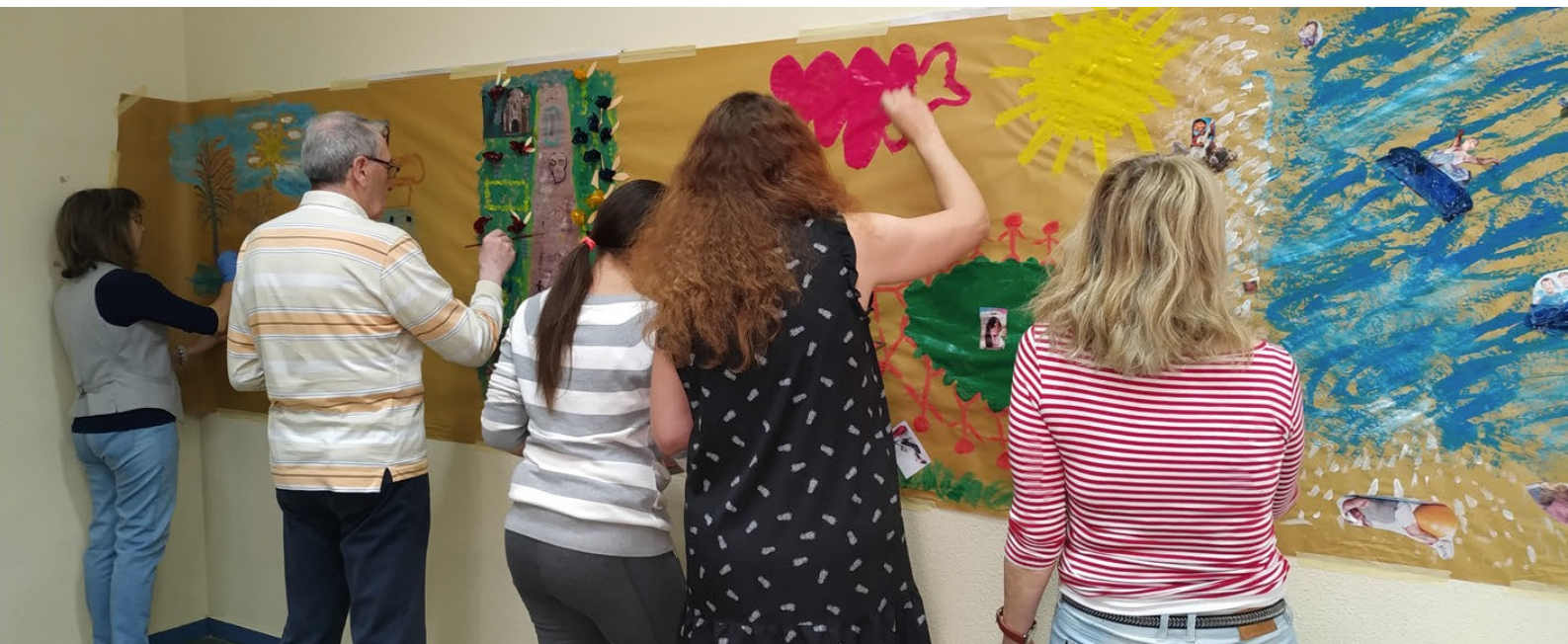
"My mask in the real and virtual world" session. Chamberí Youth Center