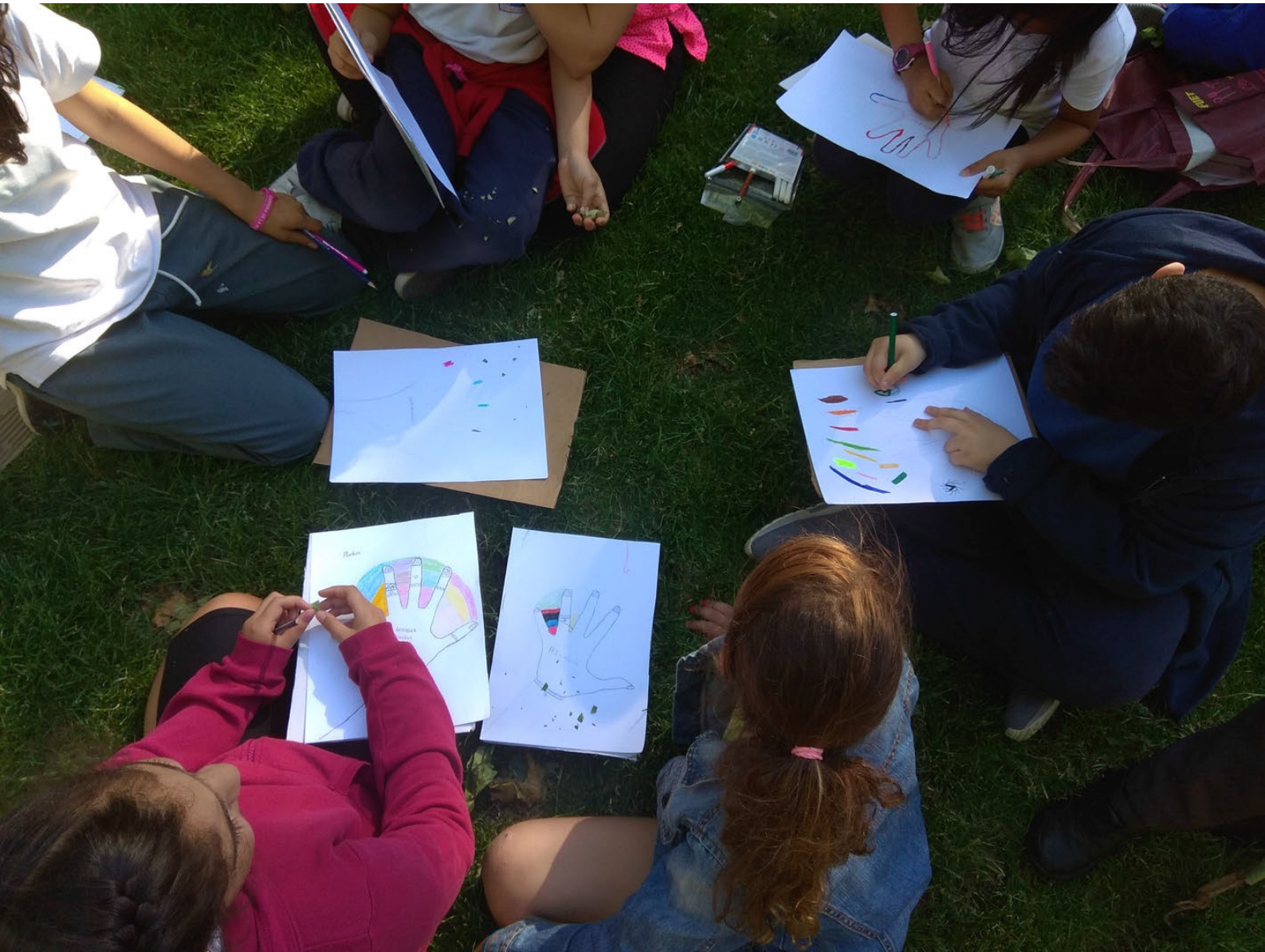
Mapping the colors of the surroundings around Madrid Centro. Youth Center