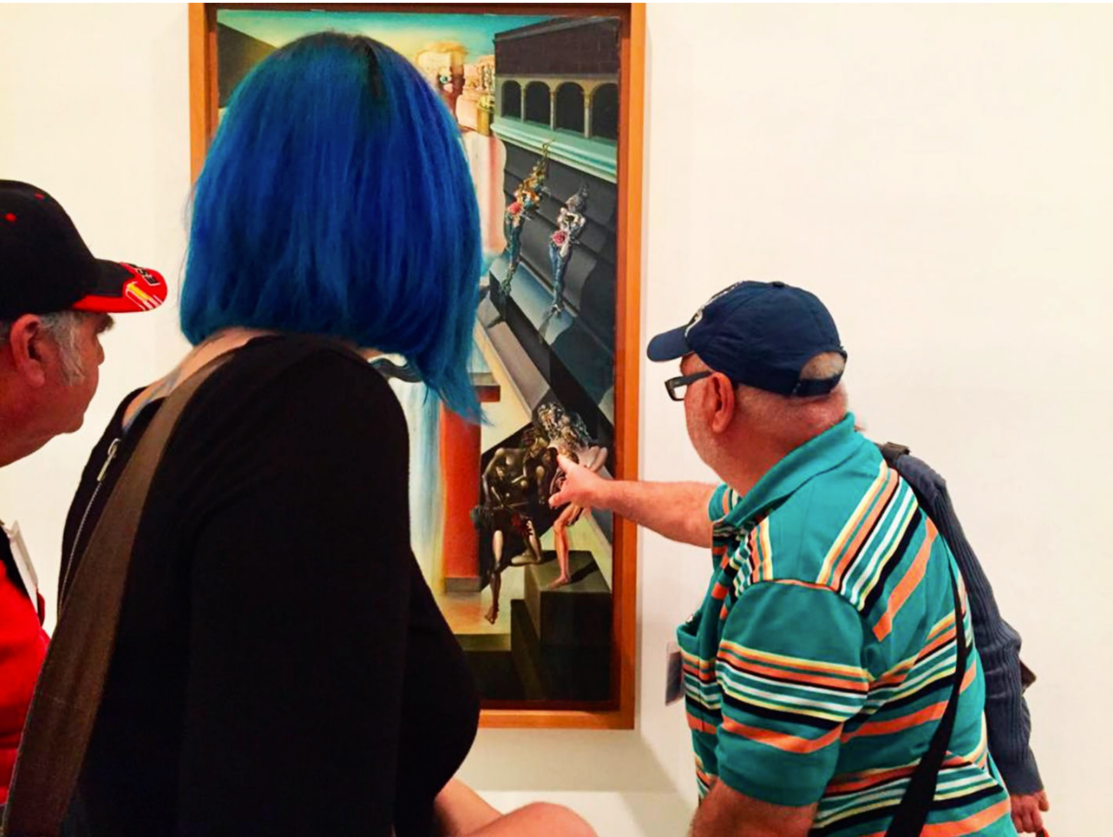
ARVICO project. Art, Bond and Communication. CMSc Ciudad Lineal