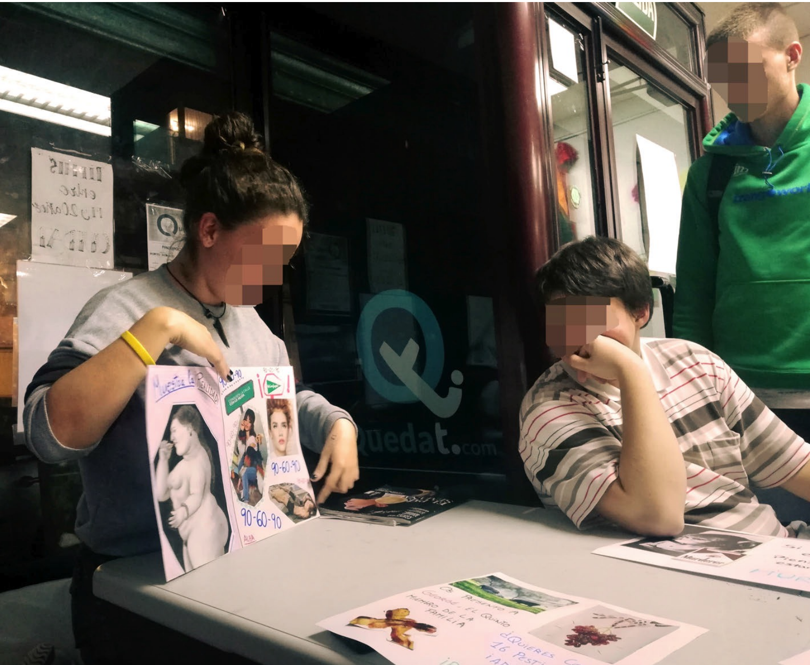
Art-Based Community network for youth. CMSc of Arganzuela