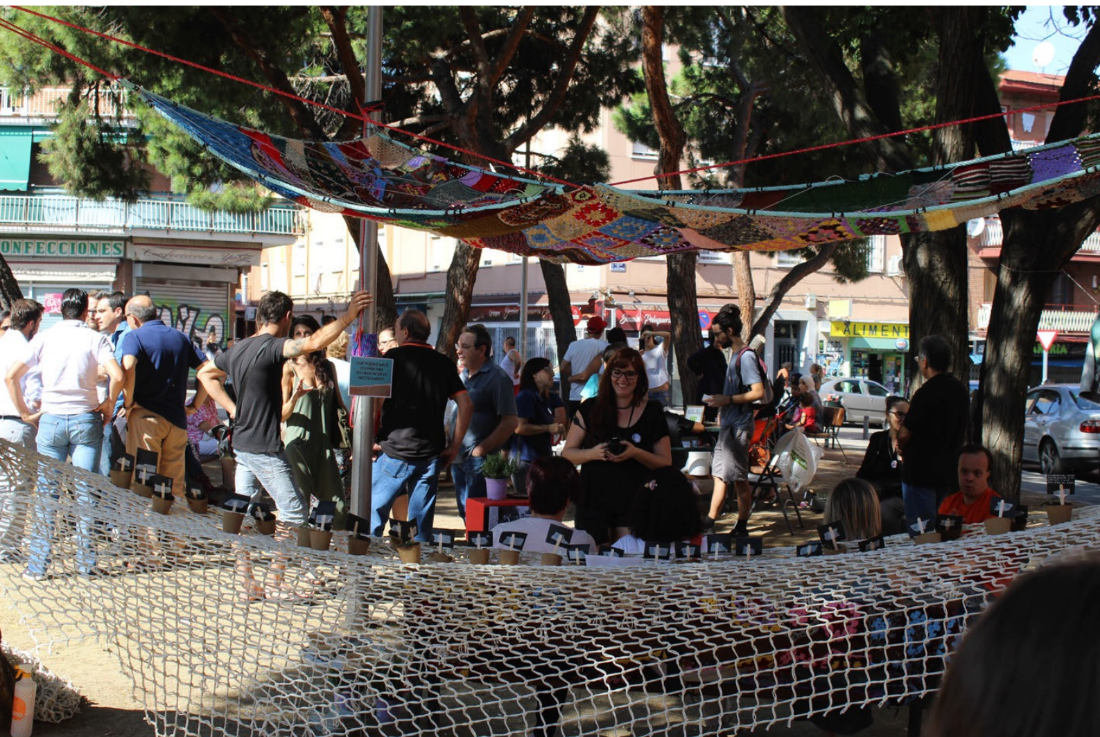
Neighborhood party, ARTYS. CMSc Villaverde