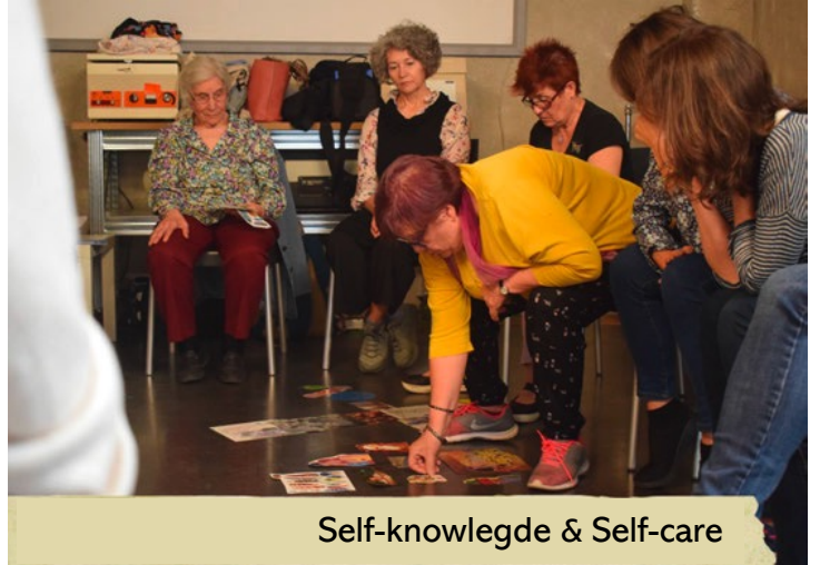
Self-knowledge & Self-care