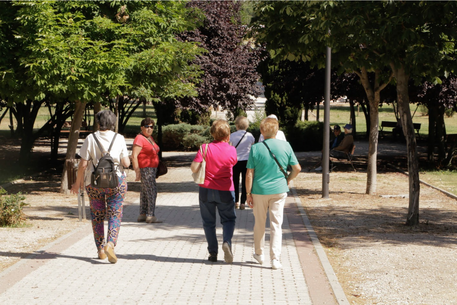
Life Stories Workshop. Filming of the video "Yesterday, today and tomorrow. The joy of sharing". CMSc Carabanchel