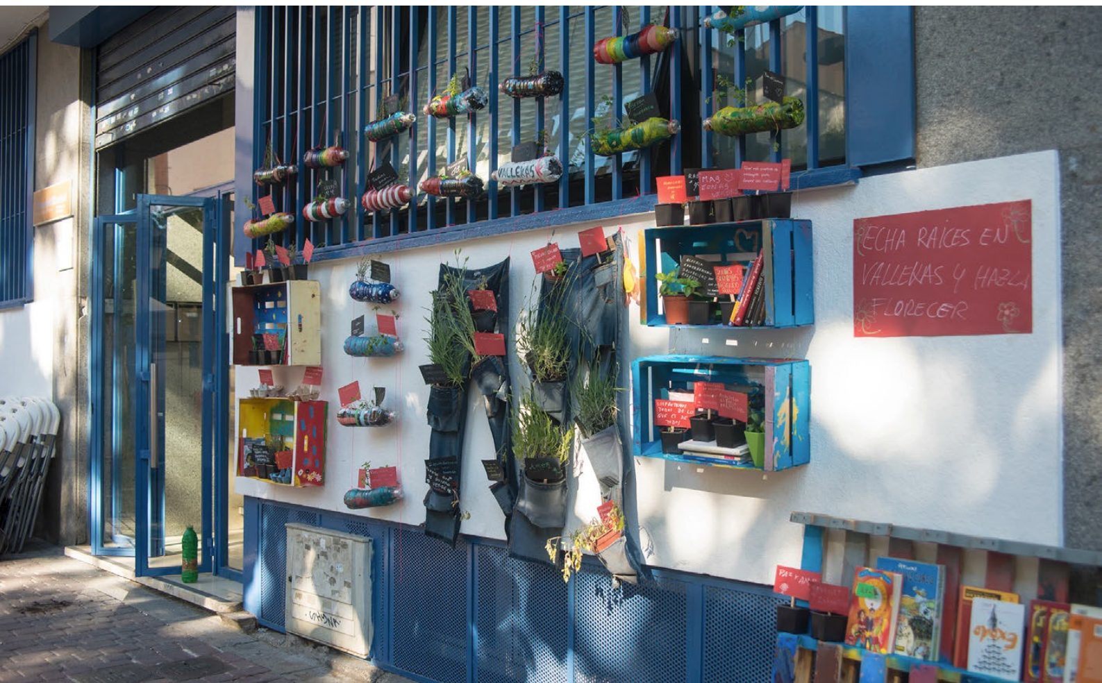
Vertical garden for the neighborhood. CMSc Puente de Vallecas