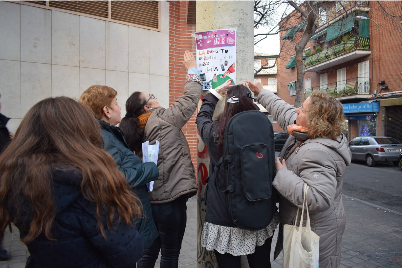
Artisims event, ARTYS. CMSc Villaverde