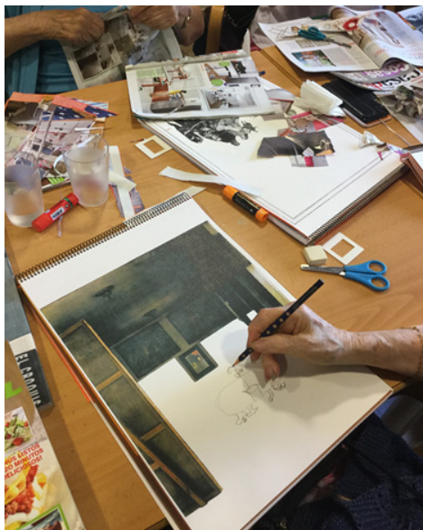
Figura 2. Proceso de creación plástica durante el taller.

Tras la presentación, se explica a los participantes en qué consiste la propuesta plástica que van a realizar, siempre utilizando las imágenes de la visita al museo como elemento visual conductor del taller. Todos los integrantes del grupo realizan su propia obra durante el taller, es decir, personas afectadas por la enfermedad, sus cuidadores y también los profesionales del centro que hayan acompañado al grupo. Integrar a todos los participantes del taller en una creación propia personal pero en un ambiente de creación colectiva es uno de los objetivos del programa y en concreto de los talleres, puesto que posibilita que todos los participantes tengan una experiencia creativa similar. Además, esto permite que se generen dinámicas de grupo en las que se diluye el rol de cada participante produciéndose una situación de igualdad en la que todos son participantes y creadores.